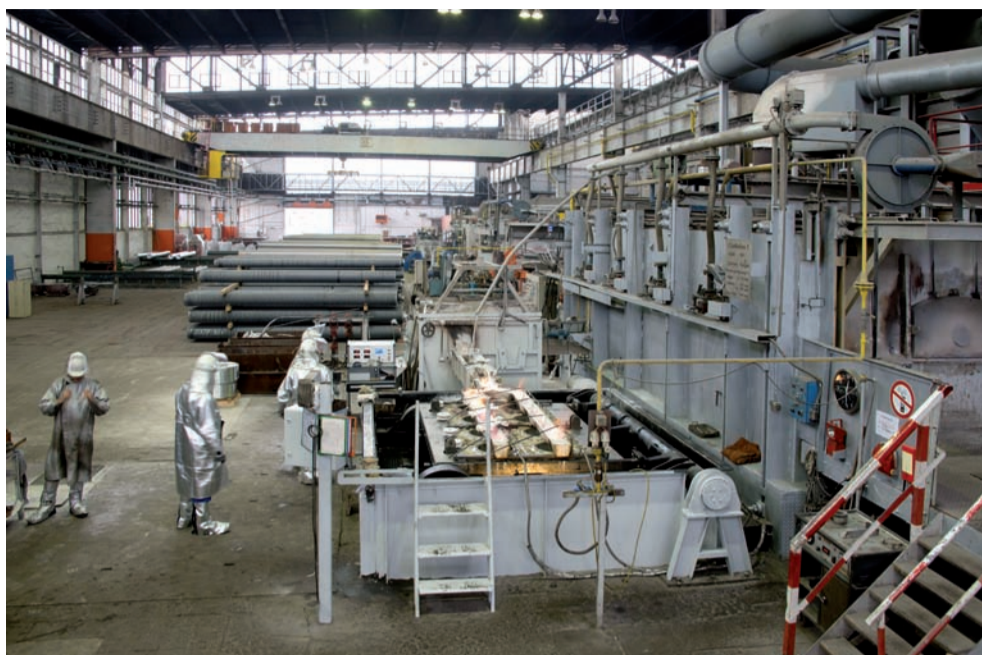
Gießerei des Aluwerks Hettstedt

Der Erwerb der Gießerei und der RMG Metallfachhandel steht im Einklang mit den Großprojekten, die STEP-G plant, um ein zukünftiges Wachstum und nachhaltige Ergebnisse sicherzustellen. STEP-G hatte Anfang des Jahres den größten Einzelauftrag in der Geschichte des Unternehmens vermeldet: Der Strangpress-Spezialist wird für Fahrzeuge auf Basis des